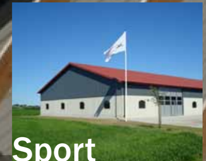
Sport & Fritid