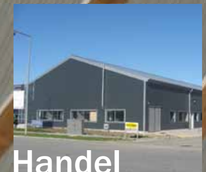
Handel & Industri